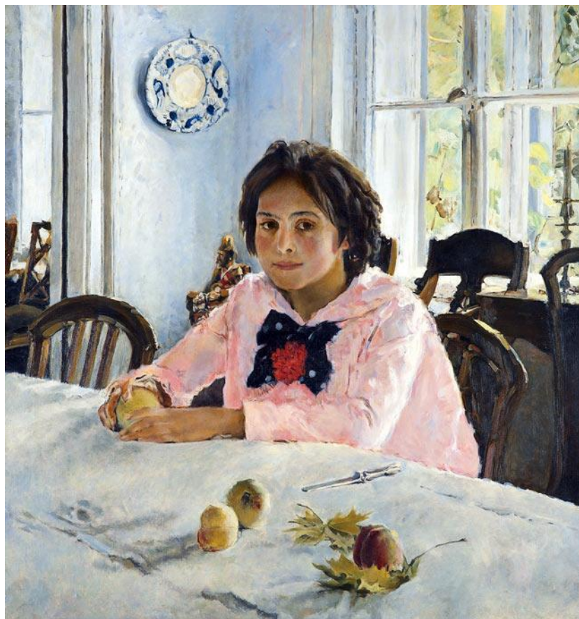
В. Серов. «Девочка с персиками»

Проанализировать произведение по следующим параметрам: