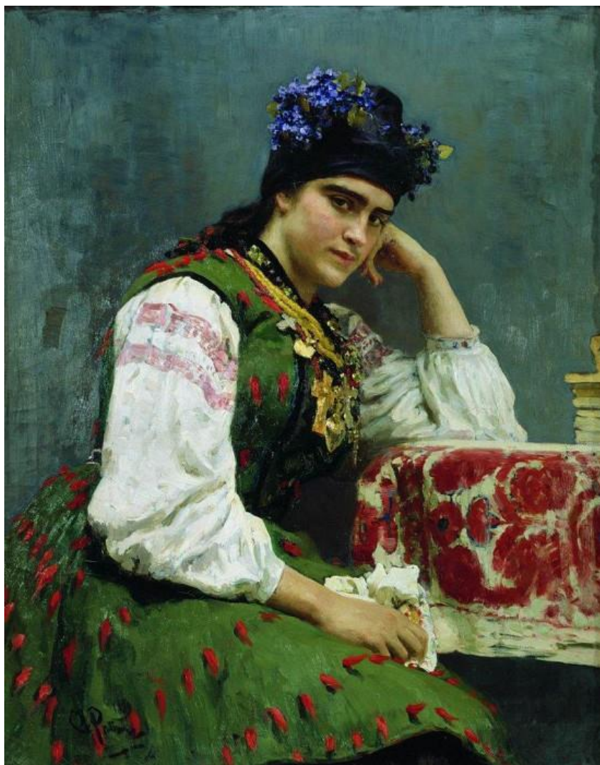
Репин И.Е. Портрет С. М. Драгомировой.

Проанализировать произведение по следующим параметрам: