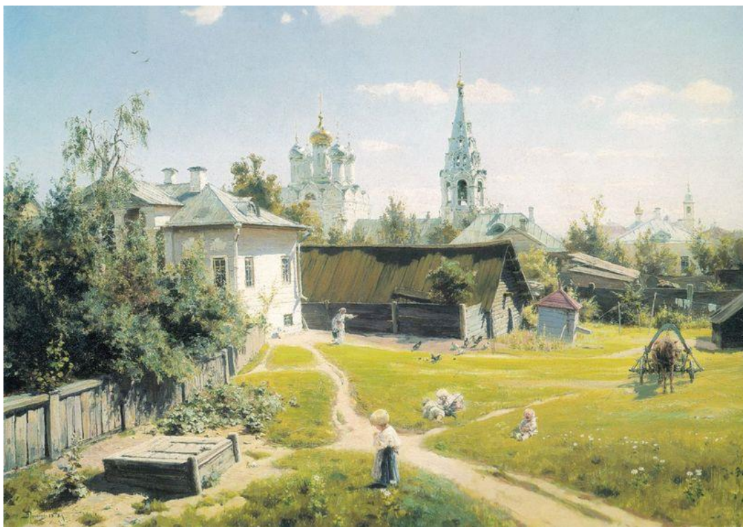
В. Поленов. «Московский дворик»

Проанализировать произведение по следующим параметрам: